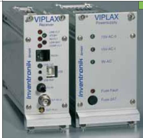
VIPLAX- Empfänger mit Netzgerät

Weitere herausragende Merkmale des VIPLAX-Systems: