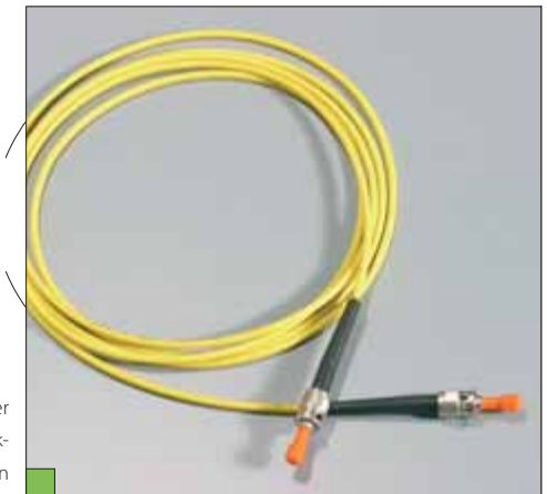
Lichtleiter mit ST-Steck- verbindern