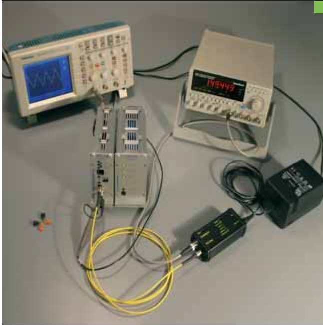
Demo-Aufbau des VIPLAX-Systems